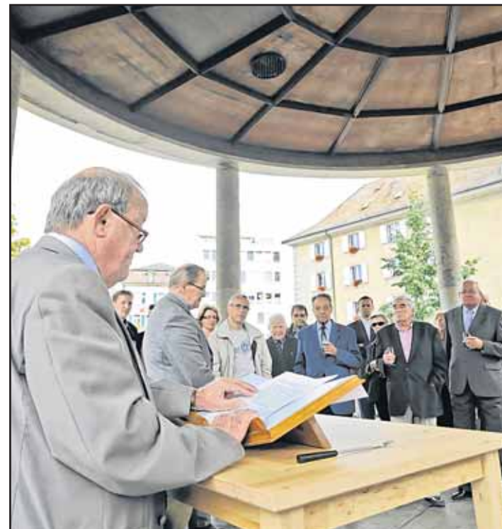
C'est au kiosque à musique de la place Georges-Python que s'est déroulée la fête pour marquer les vingt ans du parking des Alpes.